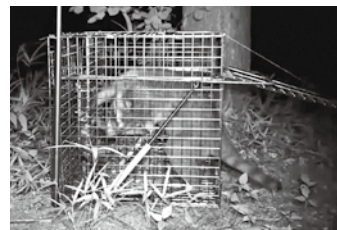
捕獲器に入るアライグマ